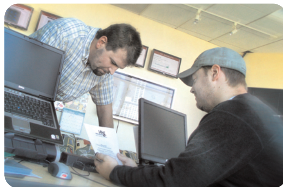
Das LiveSecurity-Team strebt eine Reaktionszeit von 4 Stunden an